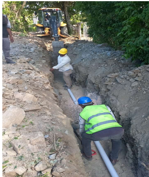
CÁRCAMO LA TOMA