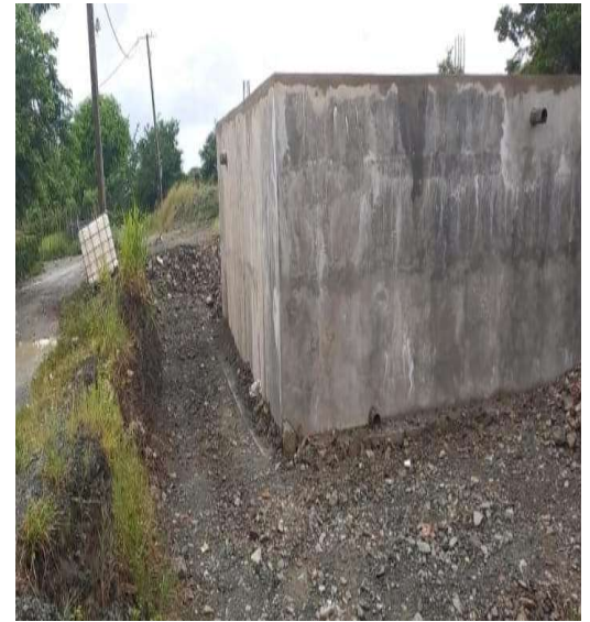
LÍNEA DE IMPULSIÓN