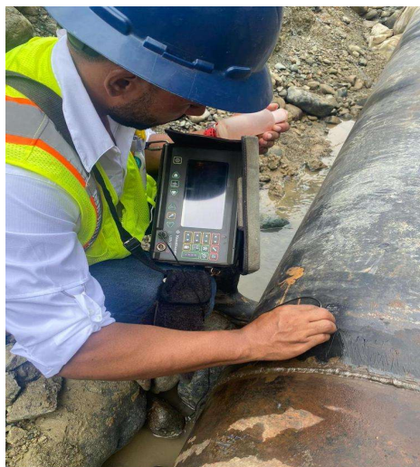
LÍNEA DE ADUCCIÓN VILLA ALTAGRACIA